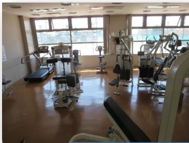
久しぶりに運動して汗をかきました！