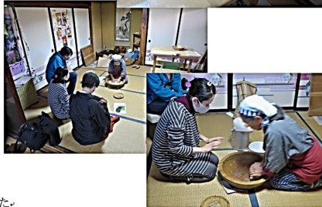
とても美味しいお蕎麦でした。