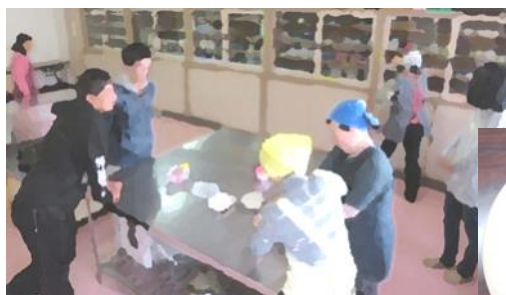
長野市障害者福祉センターで