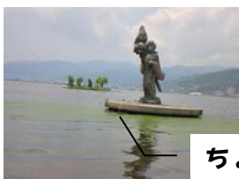
ちょっと強面の八重姫でした。